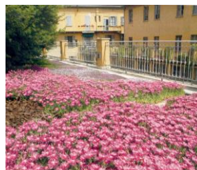
Tra cielo e cemento: un angolo di paradiso a Milano

Un intervento paesaggistico ha reso abitabile il tetto di un vecchio loft.